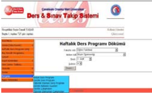
Şekil 3: Ders Programlarının dökümü

Öğrenci Girişi: Öğrenciler için gerekli olan bilgi ve duyuruların oluşturduğu sistemdir.