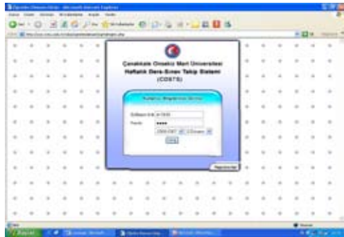
Şekil 2 Kullanıcı Girişi

Ders yükü Onaylama menüsünü kullandığınızda aşağıdaki ekrana benzer bir ekran karşınıza çıkar.