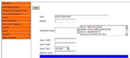
Şekil 4 Sınav Giriş Demosu

Şekil 4 olduğu gibi yıl sonu ve ara sınavlar sisteme koordinatörler tarafından veri girişi yapılmaktadır.