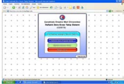
Şekil 1 Ana Menü

Şekil 4 olduğu gibi yıl sonu ve ara sınavlar sisteme koordinatörler tarafından veri girişi yapılmaktadır.