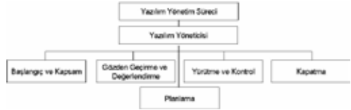
Şekil 4. Yazılım mühendisliği yönetim süreci faaliyet taksonomisi

Yukarıda listelenen tüm faaliyetlerin farklı kaynaklar ile birlikte bir ajan ya da etmeni mevcuttur. Bu ajan ya da etmen yazılım mühendisliği yöneticisi ya da ilgili faaliyeti yürüten nesnedir. Yazılım mühendisliği yönetim süreci taksonomisi, yazılım mühendisliği yönetim süreci üst-verisinin tanımlanmasına da yardımcı olacaktır. Şekil 4’ de yazılım mühendisliği yönetim süreci taksonomisi verilmiştir.