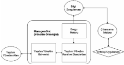
Şekil 2. Yazılım mühendisliği yönetim süreci anlamsal modeli

ontolojisi kısaca ManagemOnt [71-72] olarak isimlendirilmiştir.