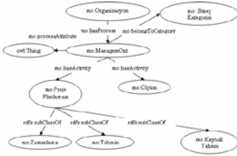
Şekil 7. ManagemOnt RDF grafiği (kısmi)

ManagemOnt modellenirken aşağıdaki ontoloji geliştirme araçları [69] incelenmiştir: