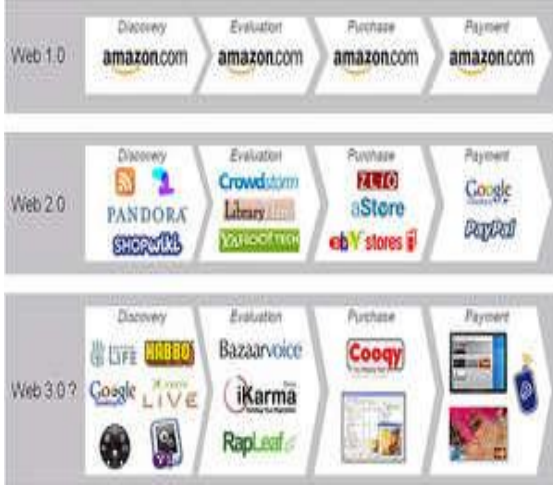
Şekil 4. Web 1.0, Web 2.0, Web 3.0

Anlamsal ağ ve Web 3.0 yapısıyla birlikte web üzerinde önceden anahtar kelimelerle yaptığımız aramaları artık derdimizi yazarak yapacağız.