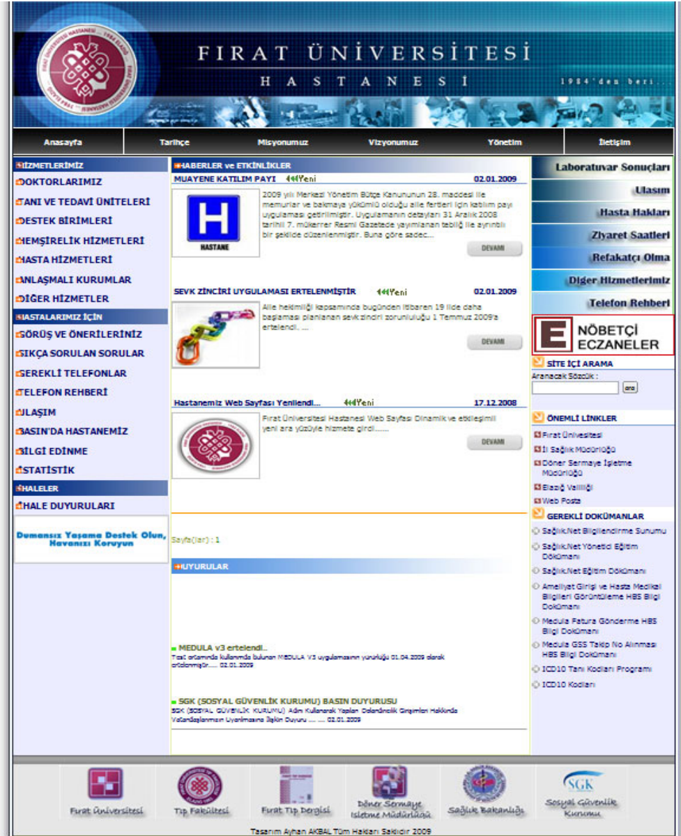
Şekil 1. Fırat Üniversitesi Hastanesi Web Sayfası