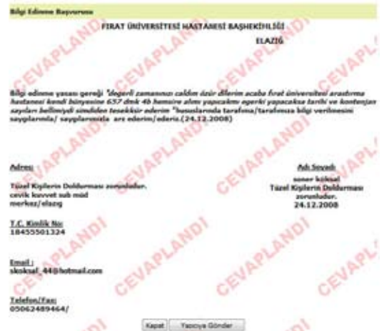
Şekil 20. Bilgi Edinme Birimi, cevaplanan bilgi.