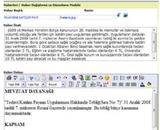
Şekil 18. Yönetim Modülü-Haber Detay

Yönetici modülünde, Haber Yönetimi, Duyuru Yönetimi, Tanı ve Tedavi birimleri yönetimi, destek birimleri yönetimi, doktorlar yönetimi, Sol menü genel yönetimi, sağ menüde bulunan hızlı linkler, dokümanlar, Bilgi edinme, basında hastanemiz, Kullanıcı işlemleri gibi site ile ilgili tüm işlemleri yönetici modülü üzerinden yapılmaktadır.