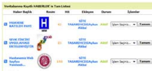
Şekil 17. Haberler Yönetim Modülü

Şekildeki gibi gelen yönetici arayüzünde sol kesimde kullanıcı yetkisine göre kullanılabilecek menüler ve orta kısmında login olan kullanıcı adı soyadı ile karşılama ekranı bulunmaktadır.