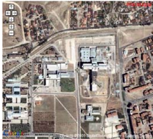
Şekil 15. Ulaşım-Uydru Görüntüsü

Hastaneye diğer çevre illerden ulaşabilmek için hastanenin uydru görüntüsü Google Earth kullanılarak web sayfasına entegre edildi.