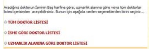
Şekil 7. Doktorlar menüsü

Bu menüden hastanede görev yapan doktorların listesine ulaşılabilmektedir. Hastanede çeşitli branş ve sayıda doktor çalışmaktadır. Bu menüden istenirse doktorların tüm listesine, isimlerine göre listesine ve branşlarına göre listesine ulaşılabilmektedir.