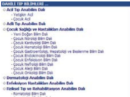
Şekil 5. Tanı ve Tedavi Üniteleri