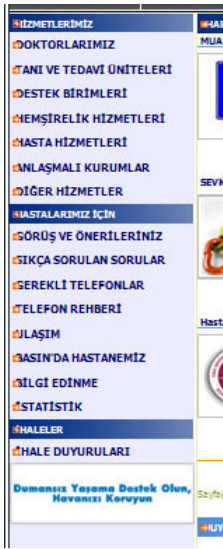
Şekil 3. Sol menü

İkinci kısım sayfanın sol kısmında bulunan menüdür bu menü hiyerarşik bir yapıya sahiptir ve site yöneticisi tarafından istenildiği kadar blok ekleme ve eklenen blokların sıralamalarını değiştirme imkânı sunmaktadır. Bu menüde hastanede verilen tıbbi hizmetler, hastanede hizmet veren doktorlar, hemşirelik hizmetleri, destek birimleri, hastaların sıkça sordukları sorular, hastanenin anlaşmalı olduğu kurumlar, ulaşım, bilgi edinme, hastane ilgili istatistiklerin olduğu bir menüdür.