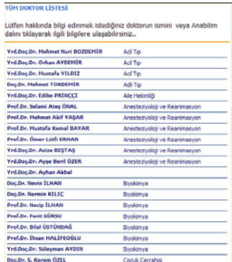
Şekil 8. Tüm doktorlar listesi

Bu menüden tüm doktorların seçilmesi durumunda Şekil 8 deki gibi bir ekran elde edilir.