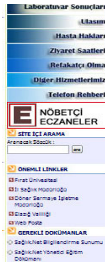
Şekil 5. Sağ bölge