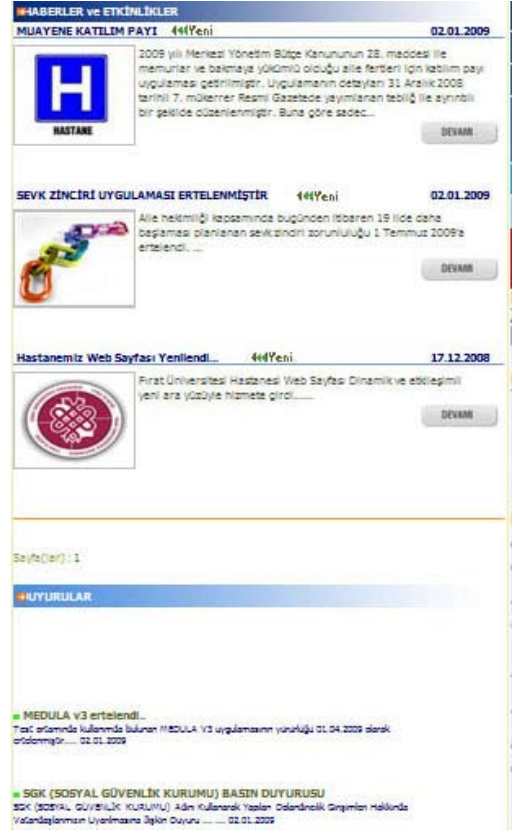
Şekil 4. Orta kısım

Üçüncü bölüm ise sayfanın orta kısmını oluşturmaktadır. Bu kısımda güncel haberler ve duyurular verilmektedir. Yönetim modülünde girilen haberler veya isteğe bağlı olarak süreli duyurular bu bölgede gösterilmektedir. Haberlerin detay sayfalarında haberlerin eklenme tarihleri, okunma sayıları gibi basit istatistiksel bilgiler tutulmakta ve kullanıcıya bilgi amaçlı verilmektedir. Yönetici kısmından girilen ve yayında kalma ve yayından çıkma tarihleri belirtilen duyurular bu sere içerisinde web sayfası üzerinden gösterilmektedir. Ayrıca ileri tarihli duyurularda yönetici sayfasından başlangıç tarihi belirtilerek kullanılabilmektedir.