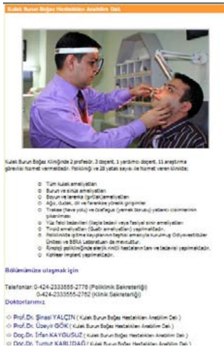
Şekil 6. Tanı ve Tedavi Üniteleri –Detay sayfası

Bu kısımda hastanede hizmet vermekte olan Tıbbi Tanı ve Tedavi birimlerin gruplandırılmış listesine ulaşılmaktadır. Tıbbi Tanı ve Tedavi birimlerinin listesi ve detaylı bilgileri verilmektedir. Yönetici sayfasından görev yaptıkları birimlere göre girilen doktorların listesine ulaşılmaktadır.