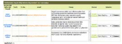
Şekil 19. Bilgi edinme istem sayfası