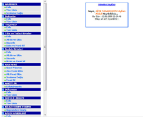
Şekil 16. Yönetici Modülü

disine sadece haber modülü görülecektir. Bu şekilde web sitesinin etkin bir şekilde kullanılması için ilgili birimlere kullanıcı adı şifresi ile birlikte web sitesi yönetimi eş zamanlı olarak tüm birimler tarafından yapılması sağlanmış olmaktadır.