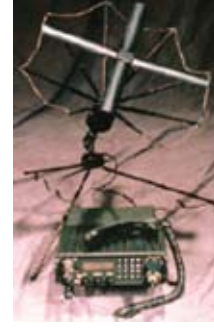
Şekil 3. Taşınabilen UFO UHF alıcısı [5]

Dar bant çözümü için TACSAT kullanılırken, daha iyi bir geniş bant çözümü için DSCS II fazına geçiş yapılmaktaydı. DSCS II kapsamında üretilen uydular DSCS I fazından farklı olarak komut alt sistemi, irtifa kontrolü ve konum koruma (uydunun yörüngesel konumunun dünyadan değiştirilmesi) özelliklerine sahipti. Program 1971 yılında Paris'te fırlatılan 6 uydudan başladı. 1989 yılına dek 16 uydudan yörüngeye yerleştirildi. Günümüzde kullanımı devam etmektedir. [5]