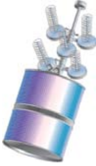
Şekil 1. TACSAT