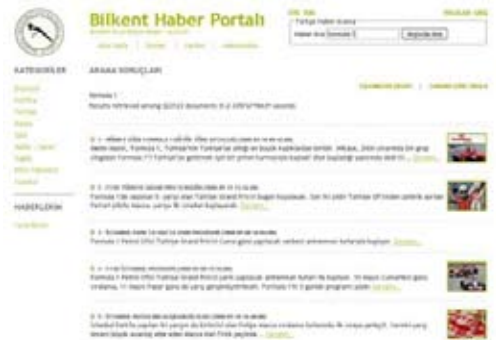
Şekil 6. Bilkent Haber Portalı bilgi erişim sonuçlarının verildiği arayüz.

Çalışmakta olan bilgi erişim sistemi konuyla ilgili yapmış olduğumuz deneylerin sonuçlarından hareketle "kök" bulma algoritması olarak kelimenin ilk 5 karakterini kullanılmaktadır [4].