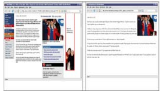
Şekil 3. Bilkent Haber Portalında içerik çıkartma işlemi örneği (sol: girdi, sağ: çıktı).

Kullanmakta olduğumuz yaklaşım kısaca üç aşamada çalışmaktadır. İlk önce resim (img) etiketlerini (tag) incelenerek, haberle ilgili olabilecek resmin adresi bulunmaktadır, daha sonra, kaynak kodundaki ilgisiz yerler ve etiketler ayrıştırılmakta ve son olarak, kalan kısımdaki metin yoğunluğuna bakılarak, bir takım sınır değerlere göre haber olma ihtimali yüksek olan bölümler saptanmaktadır. Bu yaklaşımla bir haberin içeriği çıkartılmaktadır. Şekil 3’te yapılan işlemin pratik sonuçları gösterilmektedir. Bu şekilde soldaki resim içerik çıkartma (content extraction) işleminin girdisini, sağdaki resim ise çıktısını göstermektedir.