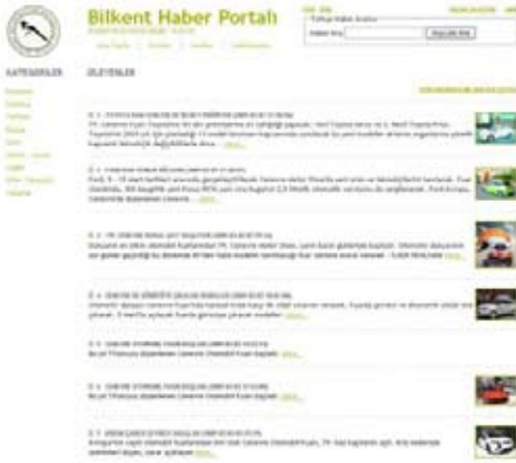
Şekil 5. Bilkent Haber Portalı'nda haber izleme sonuçlarının verildiği arayüz.