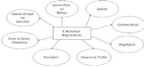
Şekil-21: e-Belediye Bilgi Sistemi ve Müdürlükler

e-Belediye, teknolojik gelişmelerin hızla değiştiği dünyada, gelişen teknolojileri kullanarak insana hizmet etmenin ve şeffaflaşmanın temelini teşkil eden yeni bir yerel yönetim aracıdır. Kent insanı bilginin küreselleştiği iletişim çağında, bilgiye ulaşma şekillerinde de çağı yakalamak zorundadır. Daha önce neredeyse bir gün harcanarak alınan bazı belediye hizmetlerine internet vasıtasıyla evden veya işyerinden 7 gün 24 saat ulaşılabilir. Bu sayede insanlar kendilerine, ailelerine ve işlerine daha çok zaman ayırabilmektedirler. Kısacası e-Belediye hizmetleri sayesinde halk, firmalar ve resmi kurumlar belediyedeki tüm işleriyle ilgili bilgilere internet kanalıyla 7 gün 24 saat ulaşabilmektedir.