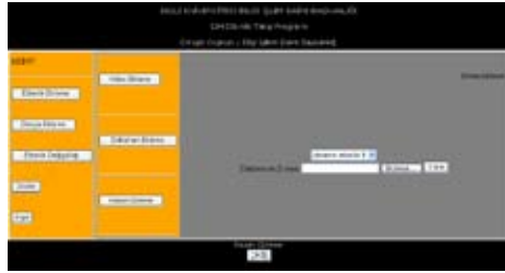
Şekil 2. Dosya Yükleme Ekranı