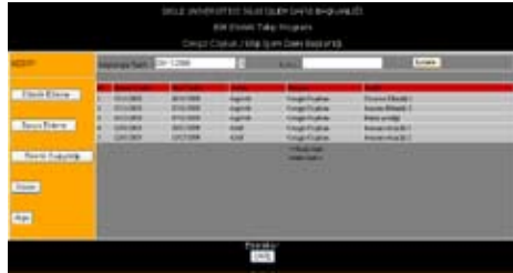
Şekil 3. Etkinlik Sorgulama Ekranı