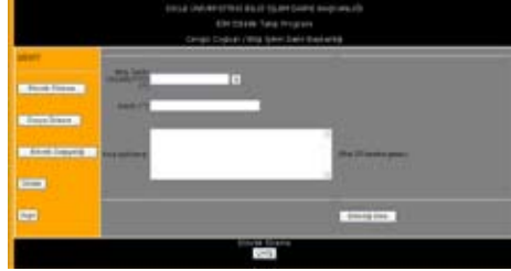
Şekil 1. Etkinlik Ekleme Ekranı

Yönetim panelindeki ana menüde “Etkinlik Eleme”, “Dosya Ekleme”, “Etkinlik Değişikliği”, “Listeleme” ve “Arşiv” başlıkları tasarlandı. “Etkinlik girişi”nde etkinliğin bitiş tarihi, etkinlik başlığı, ve etkinliğin kısa açıklaması girilerek veritabanında etkinlik tablosuna kayıt atılır. Girilmiş olan etkinlikle ilgili resim doküman ya da video görüntüleri varsa “Dosya Ekleme” menüsünden ilgili etkinlik seçilerek bu etkinliğe bu dosyalar eklenir. Yüklenen dosyalar web sitesinin bulunduğu dizinde veri tabanındaki etkinlik id'si ile yıl ve dosya tipi bazında bir klasör yaratılarak bu klasöre yüklenir. “Etkinlik Değişikliği” menüsünde aktif olan etkinlikler listelenerek istenilen etkinlik üzerinde değişiklik yapılmasına; etkinliğin silinmesine yada arşive alınmasına olanak verilir. “Listeleme” menüsünde başlangıç tarihi ve konu kriterleri kullanılarak durumu aktif, silinmiş, yada arşivde olan bütün etkinlikler arasında arama yapılarak listelenir. Konu kriteri girildiğinde girilen kelime etkinliklerin başlığında ve kısa açıklama alanlarında aranır. “Arşiv” menüsünde arşive düşmüş olan bütün etkinlikler listelenir. Arşivdeki etkinlikler, bitiş tarihi bugünden küçük olan silinmemiş etkinliklerdir. Bu listeden seçim yapılarak arşivdeki etkinlik güncelenebilir, bitiş tarihi ileri bir tarihe atılarak aktif hale getirilebilir, ya da silinebilir.