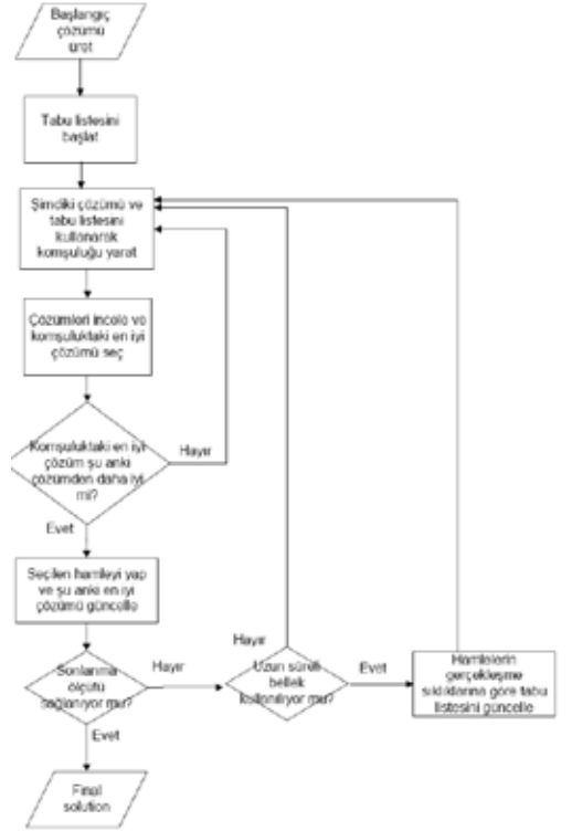
Şekil 1. Tabu araması yönteminin akış şeması.

Tabu araması, yerel buluşsal bir aramayı çözüm kümesindeki yerel en iyi çözümlerin ötesinde arama yapacak şekilde yönlendiren bir öte-buluşsal yaklaşımdır ve bunu kötüye giden sonuçları da kabul ederek yapar [1]. Tabu aramasının ana bileşenleri aşağıda açıklanmıştır.