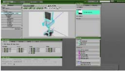
Şekil 3. Enliven Programı

Söz konusu cihazların 3 boyutlu modelleriyle Enliven programı ile uyumlu olduğu için Auto-Desk 3ds MAX 2008 programı tercih edilmiştir.