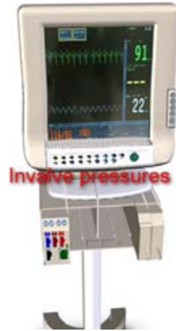
Şekil 5. Üç Boyutlu Hasta Başı Monitörü Modeli

Enliven programının temel özellikleri aşağıdaki şekildedir.