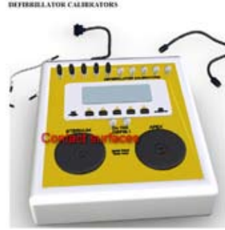
Şekil 4. Üç Boyutlu Defibrillatör Modeli

Enliven ile elde edilen model örneklerinden bazıları aşağıda verilmiştir.