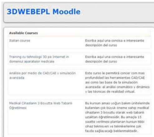
Sekil 1.3 DWebEPL Moodle Giriş Sayfası