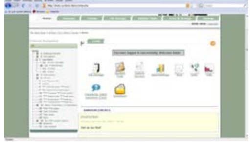
Şekil 2: ATutor Öğrenme İçerik Yönetim Sistemi