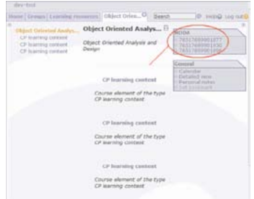
Şekil 4 Öğrenci Profile Uygun Bulunan Sıralı İçerik Listesi

MODA sistemi açık kaynak kodlu bir öğrenme yönetim sistemi olan OLAT sistemi ile entegre edilmiştir[8][9]. Şekil 3'de OLAT sisteminin ana sayfasında, MODA ile entegrasyon saplandığında aktive edilen MODA bloğu gösterilmiştir. OLAT sisteminde böyle bir blok yoktur. MODA ile entegre edildiğinde ayrıca bu modul eklenmiştir. Şekil 4'te ise öğrencinin bir derse ait ders notunu görüntülemek istediğinde karşısına çıkan içerik alternatiflerinin listesi görüntülenmektedir. Burada bir öğrenci derse ait ders notunu görüntülemek istediğinde, OLAT sistemi MODA sistemine elindeki içerik profilleri ile birlikte bildirmektedir. MODA sistemi de öğrenci profili ile birlikte bu içerik profilleri