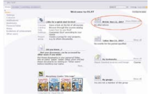
Şekil 3 MODA ile entegre edilmiş OLAT sistemi ana sayfası