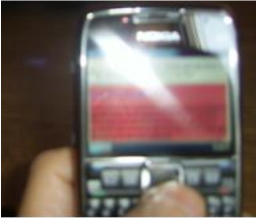
Şekil 6. Podcasting adlı yerel proje sayfasına giriş.

Şekil 5 ve 6'da sırasıyla internet erişimi sağlanmış Nokia E 71 smartphone ile mobil kod taranmaktadır. Ardından Distance Learning for Apprentices verisi kayıt edilerek Podcasting adlı yerel proje web sayfasına girilmektedir.