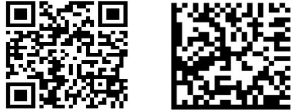
Şekil 2. http://openmobilealliance.org bilgisi kodlanmış QR ve Data Matrix kodları [1].

Şekil 2'de aynı bilgiyle kodlanmış QR ve Data Matrix kodları görülmektedir.