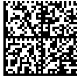
Şekil 4. Yerel proje sayfası için mobil kod.

Mobil cihazlar için tasarlanan web sayfaları sade, çok fazla grafik ve animasyon içermeyen, biçimlendirmesi için tabloların ve boş grafik nesnelerinin kullanılmadığı, scriptlerin ise mümkün olduğu kadar az kullanıldığı bir biçimde tasarlanmalıdır. Bu ilkelerle tasarlanmış, sadece bilgi maksatlı oluşturulmuş yerel proje web sayfası farklı tarayıcılar kullanan farklı mobil cihazların erişiminde en az sorun yaşayacak şekilde yapılandırılmıştır [11]. Bu sayfaya Şekil 4’te verilen mobil kod vasıtasıyla erişilebilir.