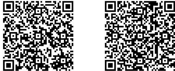
Şekil 3. Data Matrix ile kodlanmış bir web bağlantısı

İnternet'te ücretsiz olarak verilen mobil kod oluşturma hizmetinden faydalanarak QR ya da Data Matrix kodlar oluşturulup maksada uygun bir biçimde kullanılabilir. Şekil 3'de Nokia web sayfasında [6, 9] verilen hizmet kullanılarak üretilen QR kodları görülmektedir. Bu kodlarda yazarların kartvizit bilgileri bulunmaktadır.