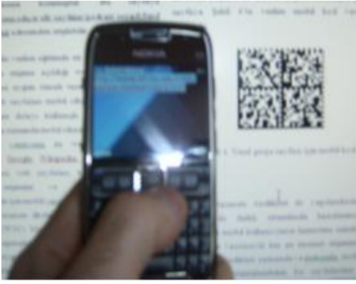
Şekil 5. Nokia E71'den, mobil kodun taranması.