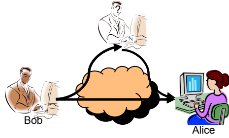
Şekil 1: Tekrar (replay) atak

Kriptografi eğitiminde, özellikle iletişim kurallarının anlatımında, görsel metaforlara ve araçlara başvurmak en çok kullanılan yöntemlerden birisidir. Bu metaforlara verilebilecek en önemli örnek, Alice-Bob, Ahmet-Belgin, gibi genel bir iletişim kanalı üzerinden iki sanal karakterin haberleşmesidir. Bu karakterler üzerinden öğretmen, sunu ya da tahta üzerinde sıralı gerçekleşen çeşitli iletişim kurallarının adımlarını ya da iletişimi tehdit eden unsurları gösterebilmektedir [6]. Şekil 1'de örnek olarak gösterilen tekrar (replay) atağında Bob, Alice'e bir mesaj göndermekte, bu mesajı dinleyen üçüncü kişi aynı mesajı Alice'e tekrar göndermektedir. Bu tür görsel araçların kullanımı kriptografi kavramlarının akılda kalıcılığını arttırmaktadır.