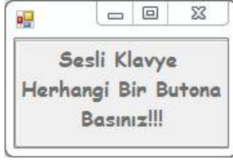
Şekil 2. Sesli Klavye Ekranı

Şekil 2’de tasarımı gerçekleştirilen sesli klavye sisteminin ara yüz yazılım ekranı görünmektedir. Klavyedeki tüm tuşlar seslendirilmiştir. Böylece görme engelli bilgisayar kullanıcısı duyduğu seslerle doğru tuşa basıp, basmadığını anlayacaktır. Eğer yanlış tuşa basmışsa düzeltme yapabilecektir. Göremediği metinleri sesle duymuş ve kontrol etmiş olacaktır.