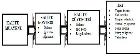
Şekil 1. Kalite Anlayışının Evrimi

1950'li ve 60'li yıllarda Philip Crosby, Edward Demings, Arnord Feigenbaum, Joseph Juran, Kaoru Ishikawa ve Genichi Taguchi başta olmak üzere çeşitli kişiler tarafından yapılan çalışmalar ve ortaya atılan fikirler, küreselleşme olarak tarif edilen ortamın ortaya çıkması ile birlikte kalite konusunu tüm işletme faaliyetlerine yön veren bir temel kavram haline gelmesine yardımcı olmuştur.