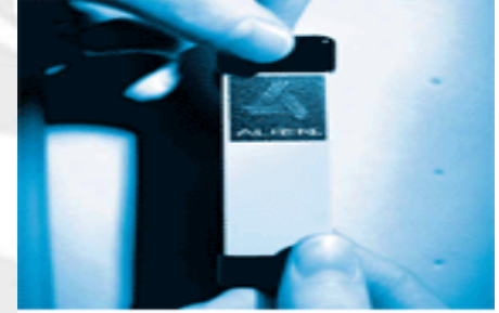
Auto-ID Center test tag