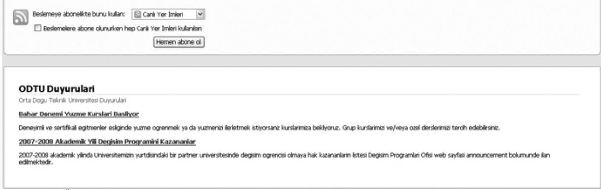
Şekil 2.ODTÜ Duyuru RSS beslemesinin Mozilla Firefox tarayıcısındaki görünümü