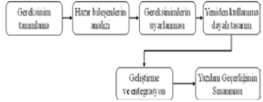
Şekil 1. Bileşen Tabanlı Uygulama Geliştirme Modeli Süreçleri

Bu model uygulama geliştirme maliyetlerini azaltıp riski düşürmenin yanında yazılımların daha hızlı gerçekleştirilmesine imkân tanımaktadır. Bu nedenle günümüzde yazılım geliştirme önemli ölçüde hazır bulunan yazılım bileşenlerine dayandırılarak yapılmaya çalışılmaktadır.