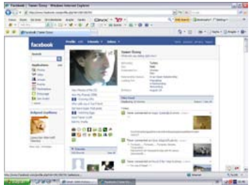
8 Haziran 2008'de 500 kişiye,

http://www.facebook.com/findfriends.php?expand=pymk&ref=hpb#/facebook?ref=pf