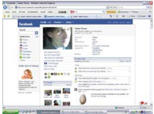
17 Mayıs 2008'de 464 kişiye,

altındaki veya 18 yaşın altında olup lise veya üniversitede eğitim görmeyen kişilerin Siteye kaydı, erişimi veya Siteyi kullanımı izinsiz ve yasaklanmış olup bu Kullanım Koşullarının ihlali anlamına gelmektedir. Hizmeti veya Siteyi kullandığında, 13 yaş veya üzeri olup lise veya üniversiteye devam ettiğini veya 18 yaş veya üzeri olduğunu ve bu Sözleşmenin tüm şartlarına ve koşullarına uymayı kabul ettiğini taahhüt etmiş sayılır.