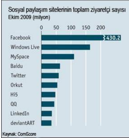
Şekil 1. Sosyal Paylaşım Sitelerinde Ziyaretçi Sayısı

Sosyal ağların en çok ilgi çekmelerinin nedenlerinden bir tanesi, insanların kişisel ilişkilerini daha gözle görünür ve hiç olmadığı kadar ölçülebilir kılmaları olarak gösteriliyor. Örneğin, gündemdeki haberler hakkında güncellemeler yapan Twitter gibi sosyal ağlar, büyük haber kaynakları için önemli bir araç haline geldi. [9]