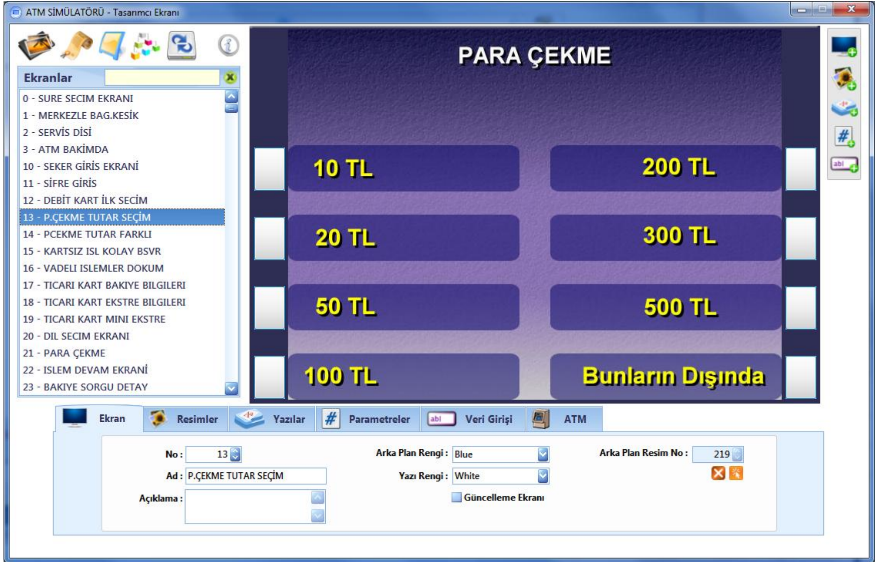
Arayüz Tasarımı Ekran Görüntüsü