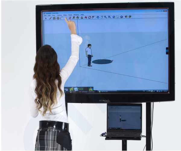
Şekil 3. Üçüncü Tip Akıllı Tahta Sistemi

Dördüncü tip akıllı tahta sistemi LCD TV ya da LED TV, akıllı tahta donanımı ve yazılımı ve bilgisayar ile kullanılır. Bu sistemin avantaj ve dezavantajları şöyle sıralanabilir: