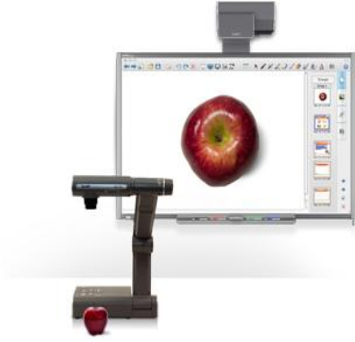
Şekil 4. Akıllı Tahtada Doküman Kamerası