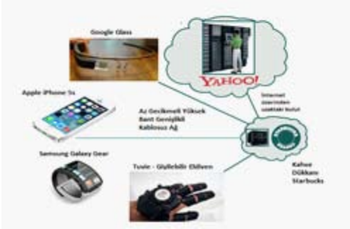
Şekil 1- Bulutçuk kullanımı örnek senaryosu

Tablo 1, bulutçuk ile bulut arasındaki en temel farklılıkları özetlemektedir.