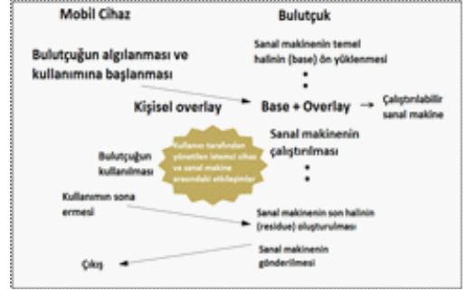
Şekil 2- Dinamik sanal makine sentezi yaklaşımı