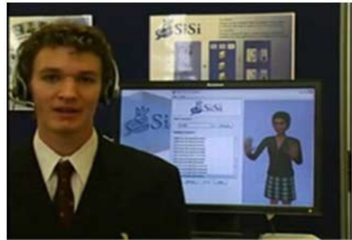
Resim 2: IBM SiSi Uygulamasının Tanıtım Videosundan Bir Görüntü 1

fazla detaylı bilgiye ulaşamamıştır. Bilindiği kadarıyla bu uygulamayı diğerlerinden ileriye taşıyan özelliği; sesi algılayıp önce yazıya sonra da işaret dili animasyonuna (bkz. Resim 2) dönüştürebilmesidir.