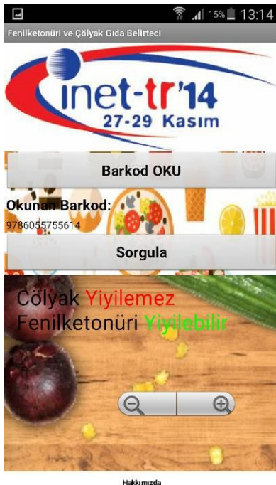
Resim 1: Barkod Okuma Ekranı

Okutulan barkod uygulama tarafından alınır ve web uygulamasındaki sayfaya parametre olarak gönderilir. Uygulamamız MIT tarafından geliştirilen ve çevrimiçi mobil uygulama geliştirilmesine izin veren MIT App Inventor[6] aracı ile oluşturulmuş ve yine aynı araç ile apk dosyası üretilmiş ve test edilmiştir. Çalışmamızda MIT App Inventor'un Android uygulama üretim aracını kullandık[7].